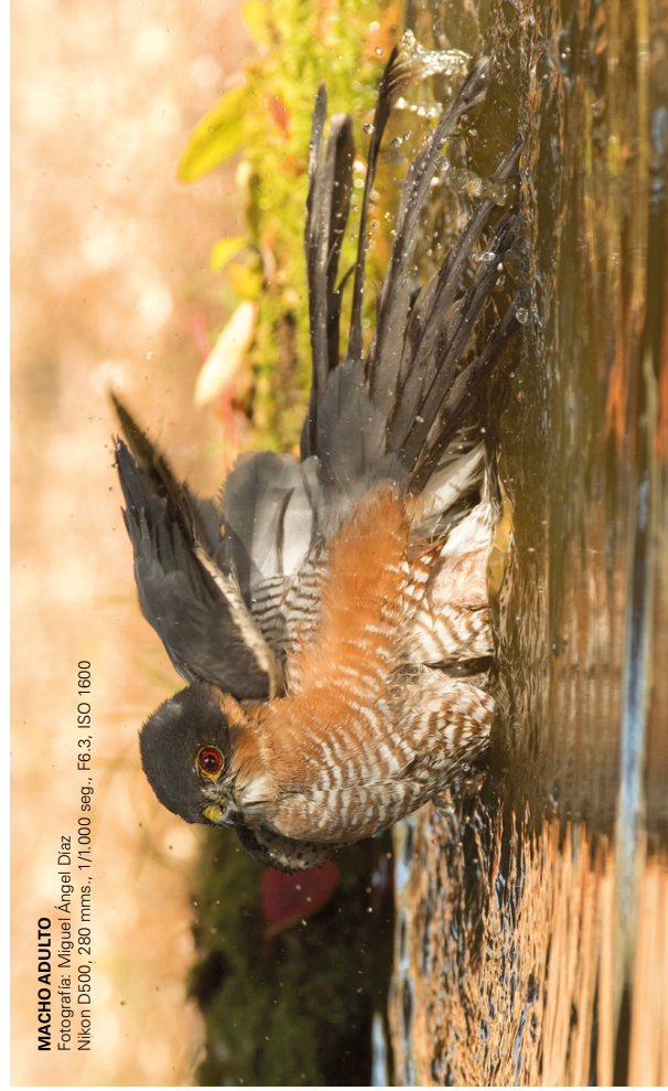
MACHO ADULTO Fotografía: Miguel Ángel Díaz Nikon D500, 280 mm.s., 1/1.000 seg., F6.3, ISO 1600

Sierra Bermeja, por contar con extensos bosques, por su cercanía al Estrecho de Gibraltar y por su ubicación en el sur peninsular, cuenta con presencia de gaviñanes durante todo el año