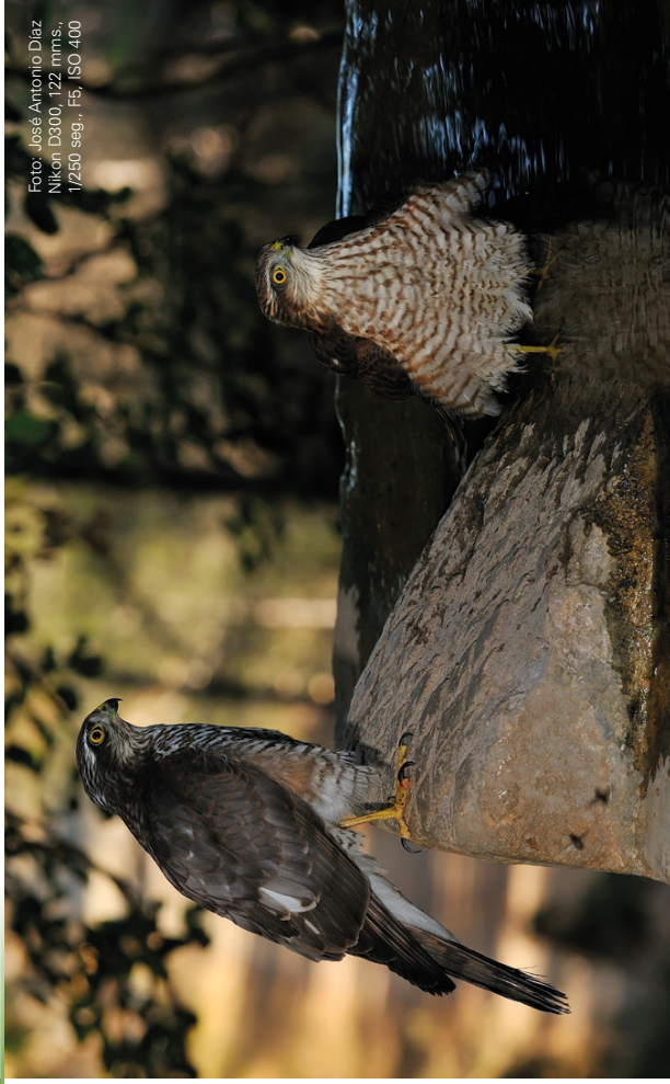
Nikon D300, 1/221 mm.s., 1/250 seg., F5, ISO 400

Pero no todos los gaviñanes emigran al continente africano. Otros muchos se quedan en nuestro territorio durante el invierno, excelente época para disfrutar viéndolos cazar en huertos, jardines, parques e incluso las calles de nuestros pueblos, en busca de paseriformes, palomas y otras aves de menor tamaño, donde además de encontrar estas presas como fuente de alimentación existe una menor presencia de depredadores y competencia.